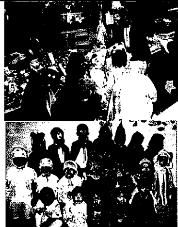
「さくら保育園先生より」

10月31日(月)ハロウィンのパレードを行いました。妖精・魔女・オバケかぼちゃに仮装した、さくら保育園の園児達が銀天町商店街を練り歩きました。 お店の前に立ちどまり「トリック・オア・トリート・ハッピーハロウィン」と元気な声で呼びかけると、お店の方々がお菓子をプレゼントしてくださりました。各お店の人達は、「あーまた今年もそんな時期になったね」と子供達と楽しげに接してくれました。通りがかりのお買い物の方々からも思いがけないプレゼントを頂いたりもしました。 今の時代にこんなに暖かく、地域に根強く浸透している商店街。人と人との触れ合う姿に本当に心が癒されました。 さくら保育園の園児達もこの暖かい人々にいつも見守られているという安心感があります。 今後商店街との心の通う交流を深めていきたいと思っています。