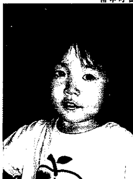
ず〜と元気でね!(ママより)

掲載希望の方は、親孝行の街づくり実行委員会 marutoku-puchi@siren.ocn.ne.jp まで!