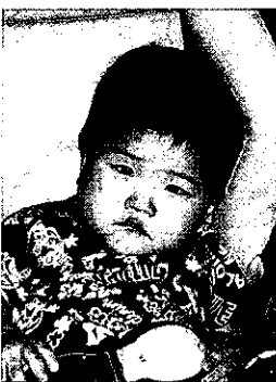
南本町に里帰り よろしく!