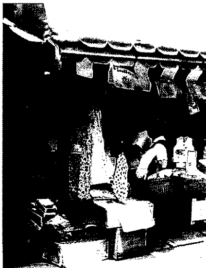
「ブティック・コウノより」

「お客様は神様です！」 昔のアルバムを、見ていましたら、そこには「銀天町商店街」ではなく「ザツシヨ」と呼ばれていた懐かしいガタガタ道の商店街と、隙間無く商品を詰め込んだ、ビックリ箱のよな店が並んでました。 今はウインドウがあり照明も明るい店舗ですが、昔は商品を良く見せる工夫はいらず、店に並べておけば売れる時代で、箱の上に布やきれいな紙を敷いて商品を並べてました。 当時の店は、専門店と呼べる店は少なく衣料品店と言えれば紳士・婦人・子ども服から学生服、下着、靴下、ネクタイ、作業着、軍手に至るまで何でも置いていました。年末ともなると一家総出で、買い物に連れられ、「ザツシヨ」はワイワイ、ガヤガヤ、賑やかで活気があり、店を閉めるのは、除夜の鐘が鳴って年を越すこともありました。最近では温暖化の影響で暖冬が続く、季節感が感じられなくなり、あの年末の忙しさも無く、新年を迎える為の花や、しめ縄飾りを買って行き来されるお客様の、姿を目にする。「今年も終わりました」と感じます。 今では需要と供給のバランスは崩れ、大型店・競合店が増え、お客様は分散し、厳しい時代が続いていますが、これだけは、今も昔も変わりません。